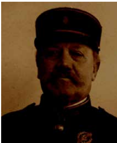
Cimetière de Bailleul N-647